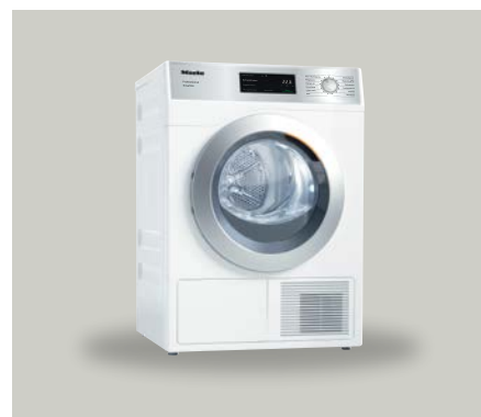
Sèche-linge pompe à chaleur PDR 1108 HP