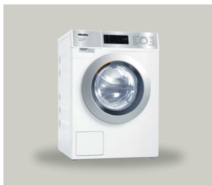
Lave-linge PWM 1108

Plus puissants, plus rapides et plus durables que les appareils domestiques : Les appareils SmartBiz sont conçus pour plusieurs utilisations par jour dans un contexte professionnel et traitent sans problème des charges que les appareils électroménagers ne supporteraient pas sur la durée. Ils maîtrisent sans effort plusieurs utilisations quotidiennes et sont conçus pour 15000 heures de fonctionnement, par rapport aux 5000 heures de fonctionnement d'un appareil électroménager Miele standard.